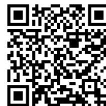
Roterra 3 000 L

Pro více informací o nádrži Roterra a nezbytném příslušenství využijte přiložený QR kód na našem e-shopu http://hospodarimesvodou.cz můžete najít mimo jiné i podrobné pokyny k instalaci k danému typu nádrže.